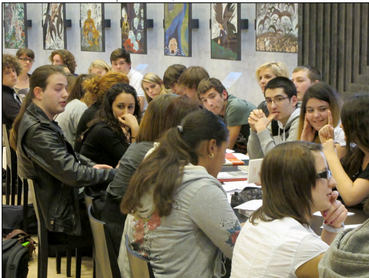
Débat pour la 2ème édition, au Centre Dürrenmatt de Neuchâtel

Le but du RdR, outre la connaissance d'un groupe d'auteurs, cherche à promouvoir la sensibilité aux formes d'expressions contemporaines.