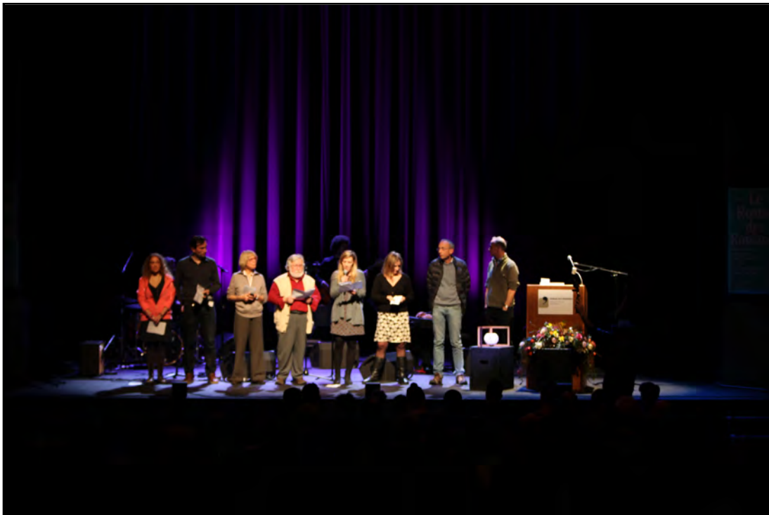
Tous les auteurs sur la scène de l'Alhambra de Genève, le 14 janvier 2016, lisent un extrait des textes en lice pour la 7 ème édition.

Suite à l'expérience exceptionnelle des six précédentes éditions avec en tout 134 classes, à la réaction des élèves, de leur entourage, de la presse et des enseignants de français, il est évident que cet investissement est très profitable dans la dynamique qu'il crée chez les élèves tout d'abord, auprès des éditeurs, des libraires, des lecteurs, des écrivains et des journalistes: il s'agit d'ouvrir l'esprit des étudiants et des jeunes d'aujourd'hui à la littérature contemporaine et de leur faire rencontrer des auteurs vivants. Il est important de rappeler que ce prix génère une émulation culturelle dans tous les lieux d'étude (plus de 24 communes impliquées) en lien avec les textes. Cet effet nomade du prix est une des richesses de la GENERATION NOUVELLE