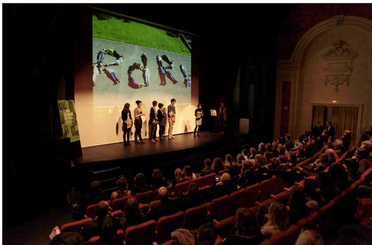
Théâtre Benno Besson - Cérémonie de remise du prix - Eloge des romans favoris par des étudiants du grand jury

L'Association a pu compter sur des partenaires privés, qui ont permis de mener à bien toutes les démarches extrascolaires : les rencontres, les débats régionaux, les déplacements et les manifestations publiques. Ce prix est en effet l'un des prix suisses (15'000 Frs) les mieux dotés en Suisse, et l'émulation qu'il crée dans toute la Romandie n'a pas d'égal à ce jour.